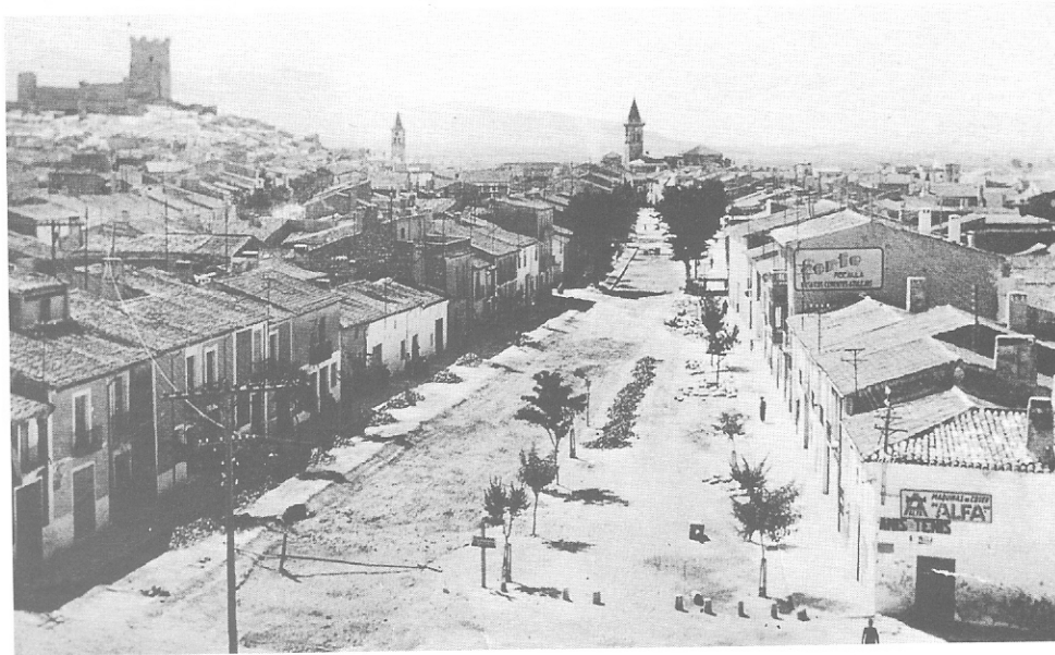
II.17. CALLE DE SAN SEBASTIÁN (Calle Ancha) FINAL Años cuarenta