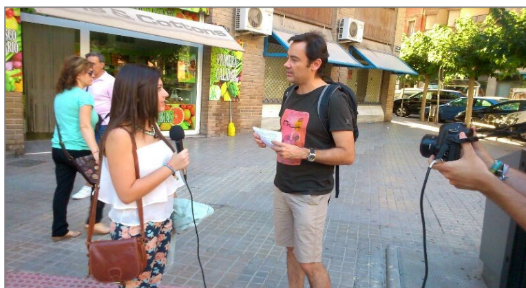
Imagen: grabación entrevista urbana Preparación

La utilización de plataformas virtuales para la deliberación puede ayudar a amplificar el proceso participativo