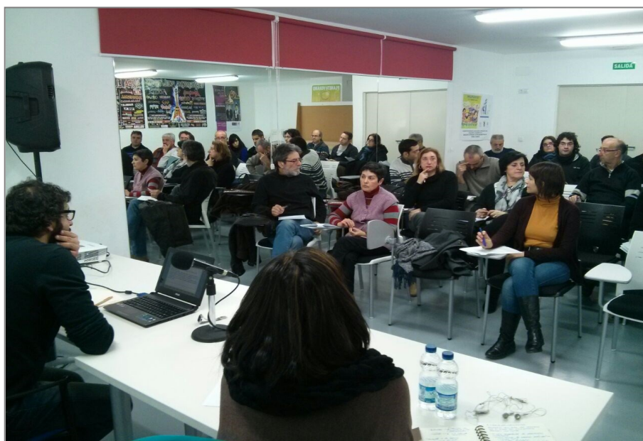
Imagen: Jornadas de devolución y debate del borrador del nuevo Reglamento de Participación Ciudadana, celebradas febrero de 2015 en Villena