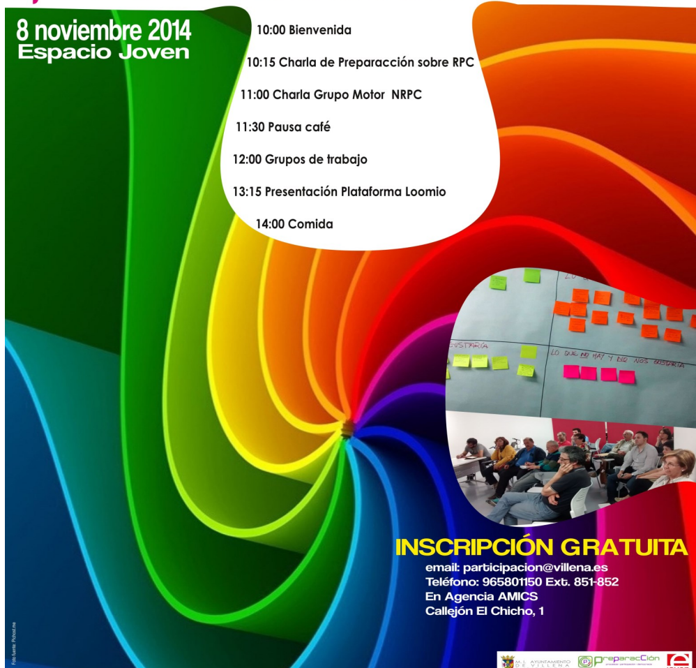
Imagen: Cartel informativo de las jornadas "Participa, tu opinión cuenta"

Paralelamente a la difusión general de este evento, también se decidió llevar a cabo un trabajo específico por parte del equipo de coordinación en los Centros de Enseñanza Secundaria de Villena, con el objeto de incorporar la voz de los más jóvenes dentro del proceso y registrar sus aportaciones. Con este objetivo se celebraron diferentes talleres y sesiones informativas sobre el proceso de participación ciudadana que se estaba llevando a cabo para la elaboración del NRPC.