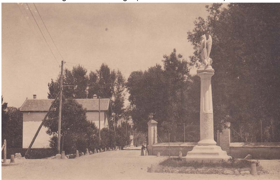
Fig. 2. Avenida Margot (Colonia de Santa Eulalia).