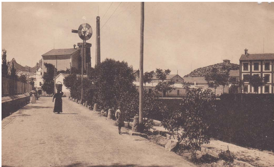
Fig. 3. Vista de la Colonia de Santa Eulalia desde la Avenida Margot.

Colección de postales de la Colonia de Santa Eulalia de Pascual Chico Beltrán.