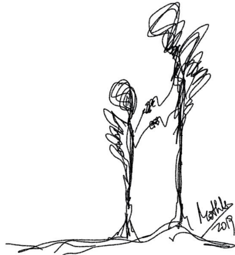
Garabato 6: Con tus alas (Mothú 2019)