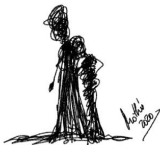
Garabato 3: Descansa en mi hombro (Mothú 2020)

Así mismo, las compañías funerarias están ofreciendo servicios de asesoramiento y acompañamiento psicológico a sus clientes. Infórmate sobre este servicio, puede ser de gran ayuda para estos momentos.