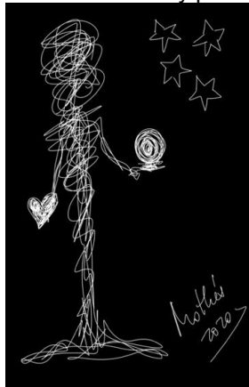
Garabato 9: Luz (Mothú 2020)