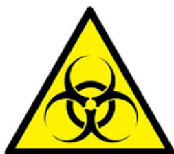
Señal de peligro biológico