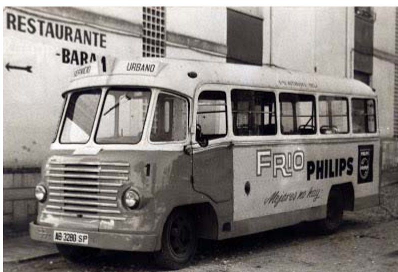
Primer autobús que hubo en Villena. Foto tomada en abril de 1964. (En la parte lateral, arriba, puede leerse “Servicio Autocares – Yecla”)