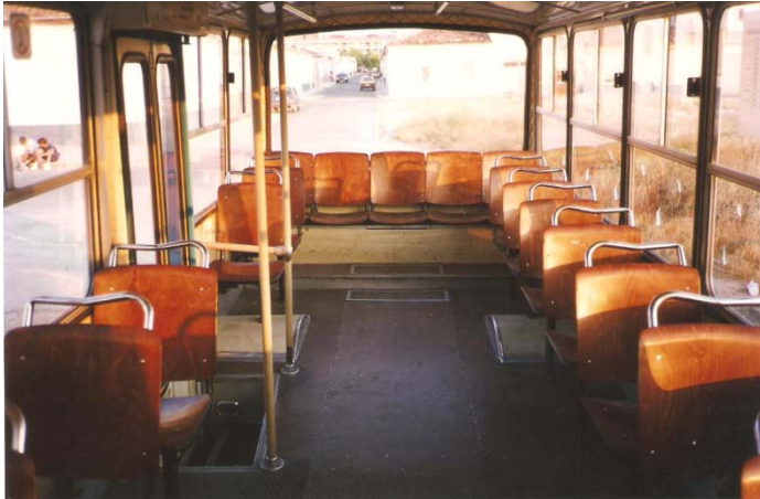
Interior de uno de los autobuses