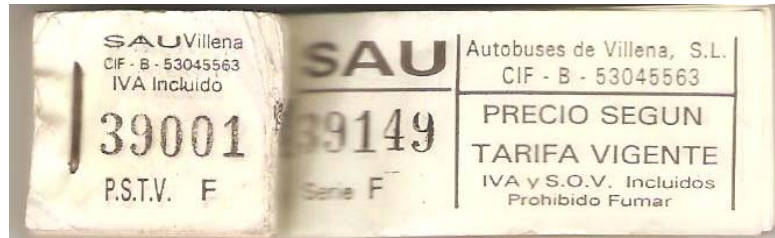
Billetes amarillos que la imprenta “Salvador Nebot S.A.”, fabrica para Autobuses de Villena, S.L.