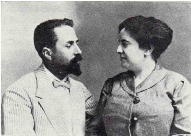
Lola junto a su marido entorno a 1920