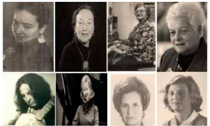
Mujeres compositoras coetáneas a Lola