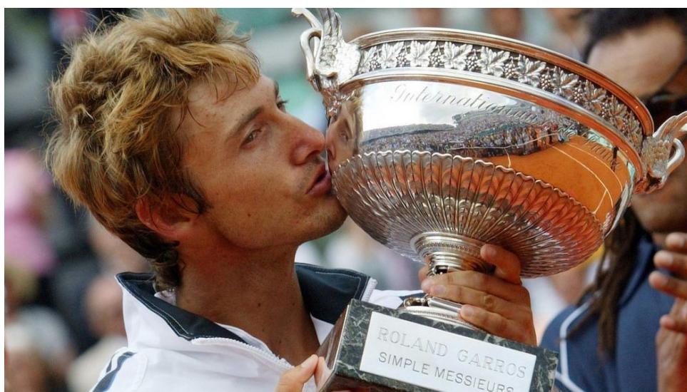
Juan Carlos Ferrero en 2003 cuando ganó el Roland Garros