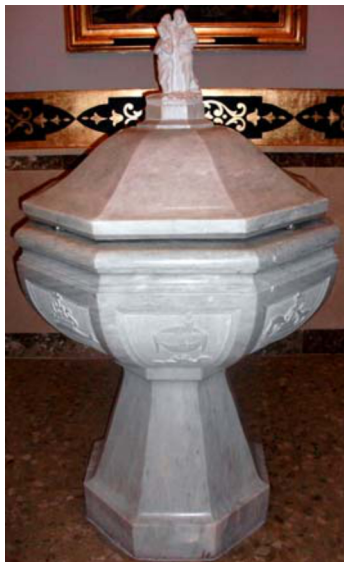
Pila bautismal Iglesia de San Cristóbal (Cañada) año 1957 (nº 7)