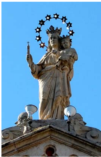
Escultura de María Auxiliadora 1957 (Foto nº 5)