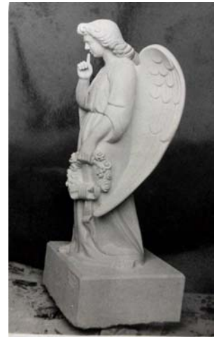
Ángel del silencio: panteón de Altea 1957 (Nº 6 )