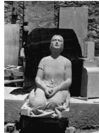
Familia Valdés: figura de mujer en rogativa 1916 (nº 4)

Francisco Cerdán García nació en 1868 y falleció en 1933. A la edad de trece años ejerció la profesión de sepulturero y se inició en el oficio de escultor de la mano de los canteros que realizaban trabajos de carácter funerario en el lugar habilitado para los piedrapiqueros en el mismo cementerio. A lo largo de su dilatada vida profesional confeccionó lápidas para nichos y para la rotulación de calles, esculpió figuras y fabricó panteones de gran calidad como los que hoy se hallan en el cementerio de Beas de Segura (Jaén). En 1916 construyó un corral taller en la calle San Sebastián que fue heredado por su hijo, el escultor Francisco Cerdán Milán.