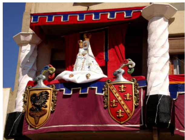
Ornamentación de Balcón Amorós Milán y Zornoza en honor a “La Morenica” septiembre del 2009

Mi interés por este tema surgió de manera casual a consecuencia de un estudio de heráldica que realicé entre 2007 y 2009 relacionado con las familias nobles y acomodadas de nuestra ciudad. A raíz de esta investigación descubrí que existía un gran vacío, tanto oral como documental, acerca de los autores de los blasones labrados en piedra y ubicados en las fachadas de las casas señoriales. Estas familias también poseían panteones en el cementerio municipal de Villena, mausoleos en los que abundaban esculturas de excepcional belleza; pero los herederos de este patrimonio con los que contacté en un primer momento no pudieron ofrecerme información alguna que revelara la identidad de los autores de las referidas obras. Este obstáculo avivó mi curiosidad al tiempo que actuó de detonante para que yo iniciara este trabajo de investigación que ha sido premiado por la Fundación José María Soler en la Modalidad Científica y Humanística. Confieso que me siento honrado y agradecido por ello.