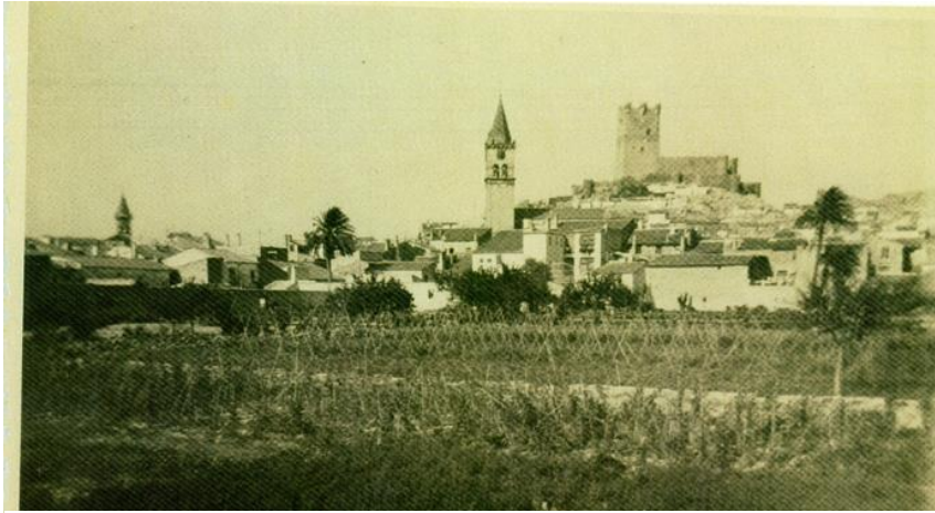
Huerto del Paraje "El Caracol"