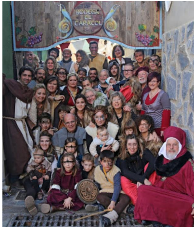
La familia "Caracol" en las Fiestas del Medievo

Fuimos, somos y seremos una gran familia, que, generación tras generación, seguiremos forjando esa unión, llevando nuestro ancestral apodo, -"Caracoles", con gran satisfacción, sabiendo que nuestros antepasados así lo hicieron como lo seguiremos haciendo nosotros.