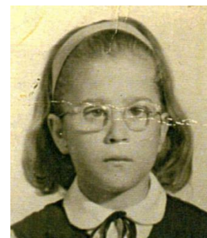
Mi abuela de pequeña