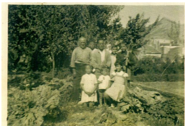
Segunda, tercera y cuarta generación en el huerto