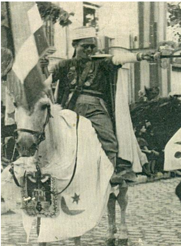
Mi bisabuelo de marrueco