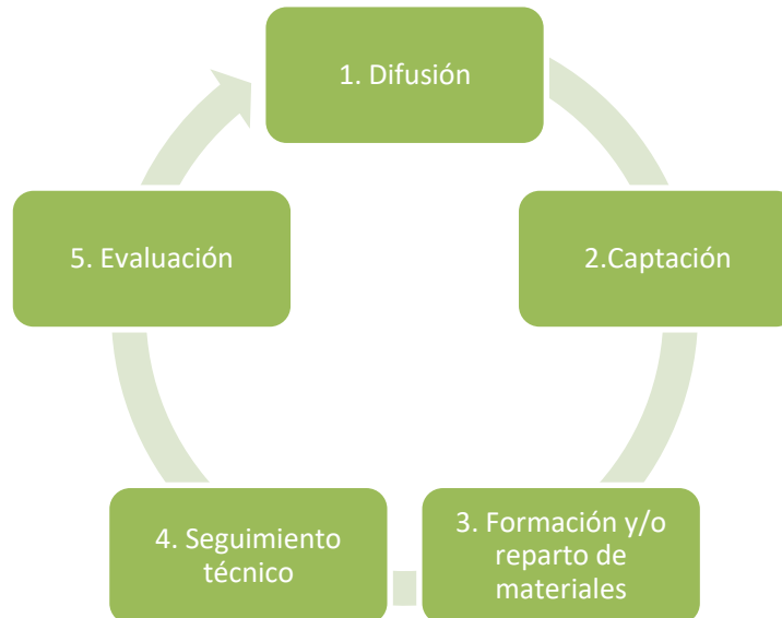
Figura 3 FASES CAMPAÑA DE SENSIBILIZACIÓN

A la hora de determinar una estrategia de campaña existen 5 fases bien diferenciadas: