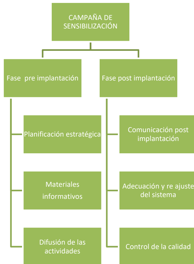
Figura 5 FASES CAMPAÑA DE SENSIBILIZACIÓN

En la siguiente imagen se detalla la división de cada una de las fases: