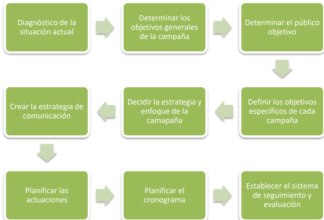
Figura 1 ESQUEMA DE UNA PROPUESTA METODOLÓGICA PARA EL DISEÑO DE UNA CAMPAÑA

En el presente capítulo se presenta una propuesta metodológica para el diseño de estas campañas en consideración de las múltiples variables que determinan el grado de éxito de una campaña de divulgación y concienciación ciudadana. El mensaje emitido, los canales utilizados o los momentos de actuación son claves para que la campaña pueda repercutir sobre el público objetivo. Se requiere, por tanto, de una planificación metódica y precisa para su elaboración, siguiendo, de modo general, en siguiente esquema: